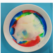
etap 3.3.jpg 100.5 KB