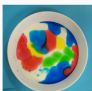
etap 2.4.jpg 93.19 KB