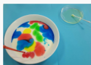
etap 2.3.jpg 79.59 KB