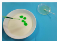
etap 2.1.jpg 72.76 KB