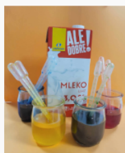
etap 1.3.jpg 111.23 KB