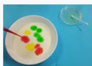
etap 2.2.jpg 70.38 KB