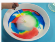
etap 3.2.jpg 80.18 KB