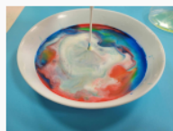
etap 4.1.jpg 99.35 KB