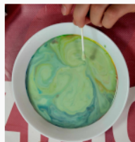
etap 4.3.jpg 170.13 KB