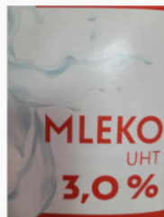
etap 1.4.jpg 83.62 KB