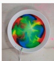
etap 3.1.jpg 148.74 KB